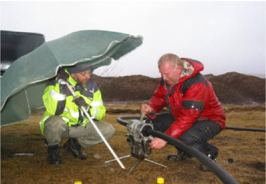
HITAVEITA FLÚÐA 40 ÁRA