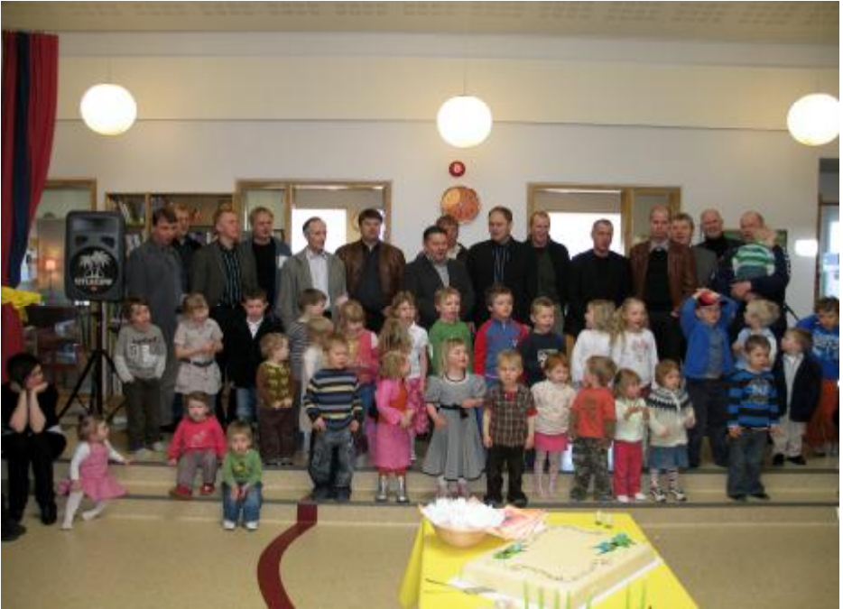
AFMÆLI Í LEIKSKÓLANUM UNDRALANDI.....