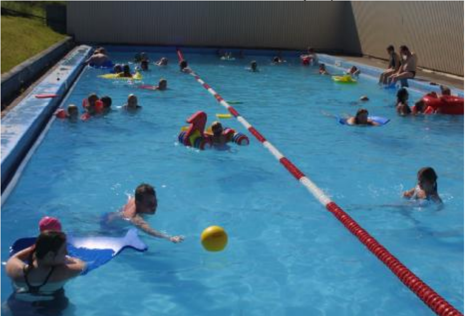
FRÍTT Í SUND Í APRÍL Í BOÐI HITAVEITU FLÚÐA. 24