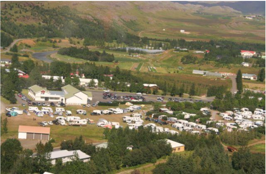
Verslunarmannahelgin á Flúðum