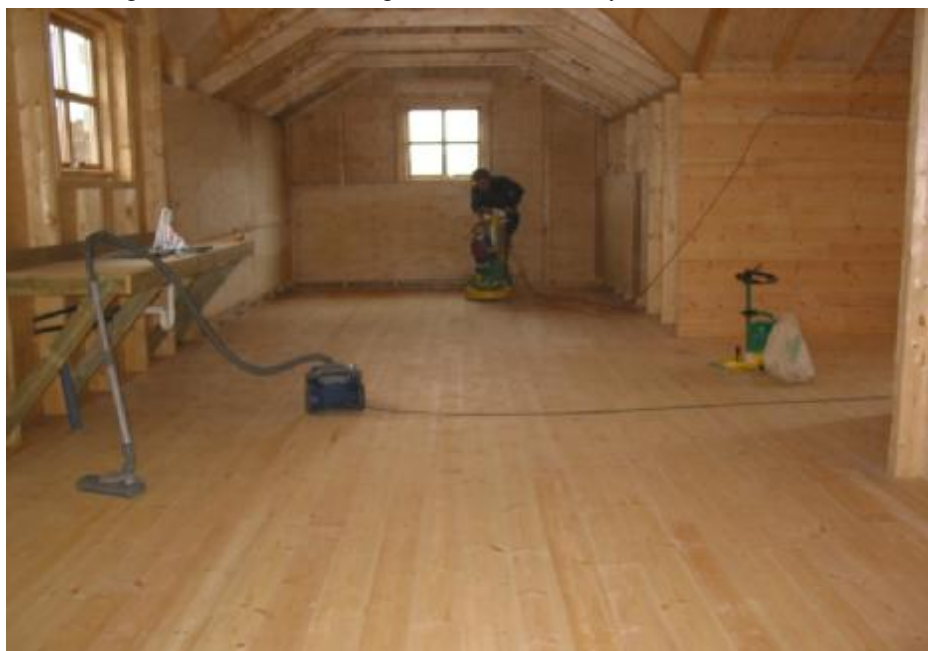
Nýi Fosslækjarskálinn, sem ÁSÆLS menn byggðu í sumar . Ljós. Hannibal