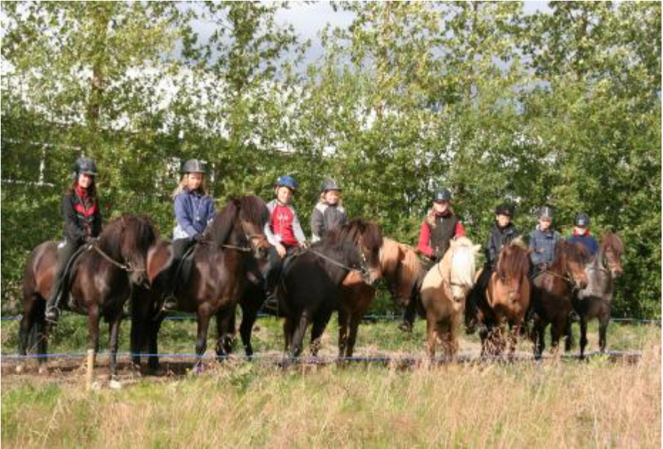
Frá Æskulýðsmóti Smára í Torfdal 25. ágúst.