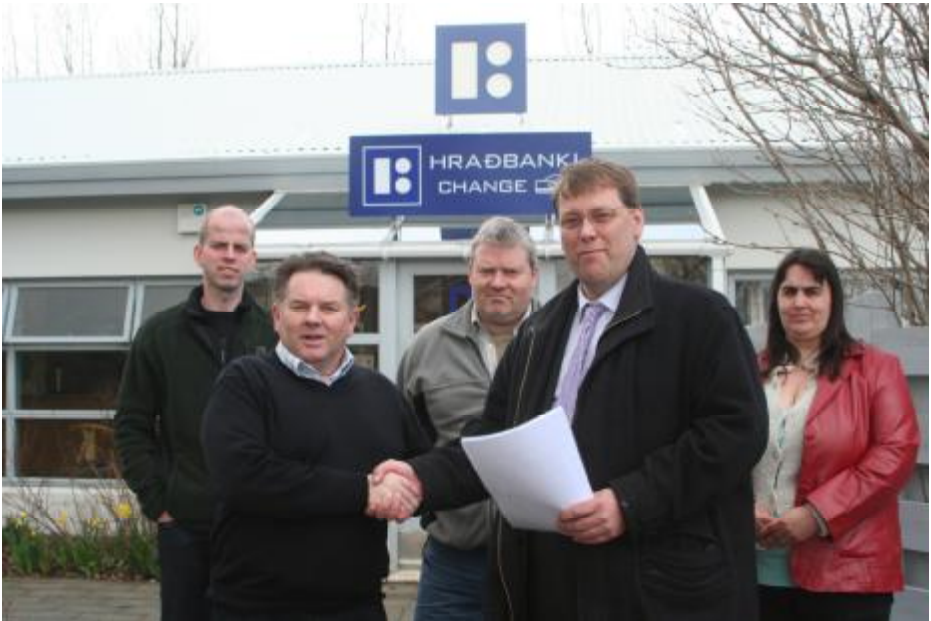
Mótmælalísti vegna lokunnar bankans afhentur