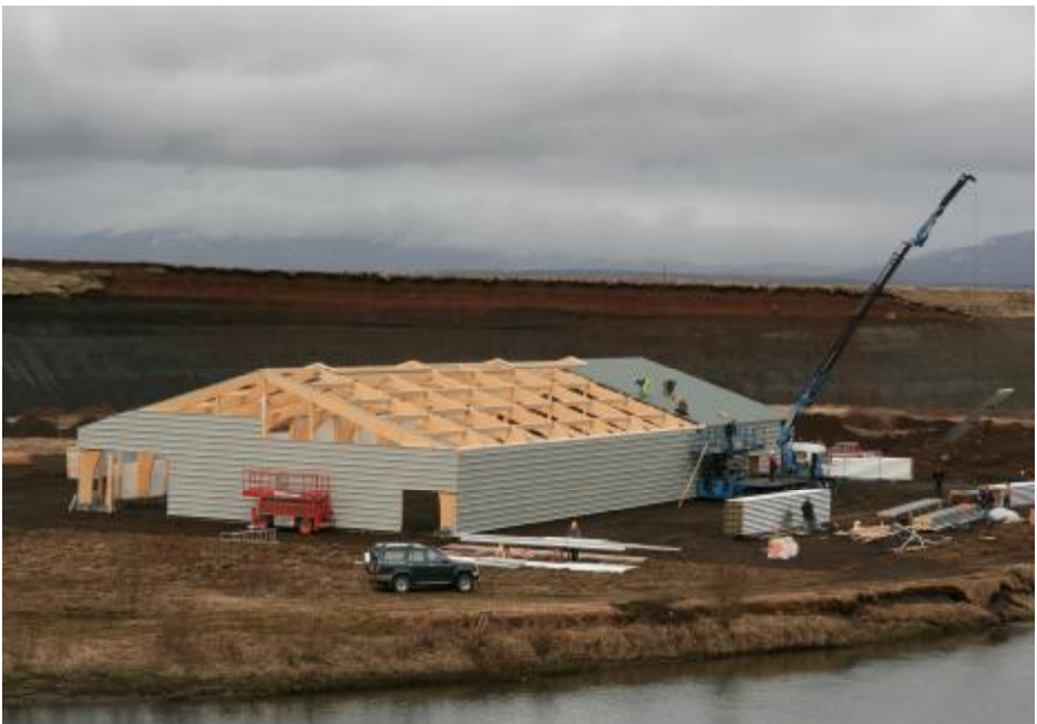
Byggingaframkvæmdir við Reiðhöllina Myndin tekin 11 maí sl