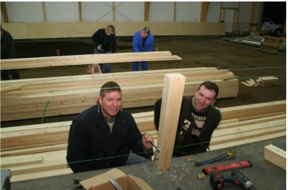
Sjálfbóðaliðar að störfum í reiðhöllinni sl.mánudagskvöld,en 22 sjálfbóðaliðar mættu