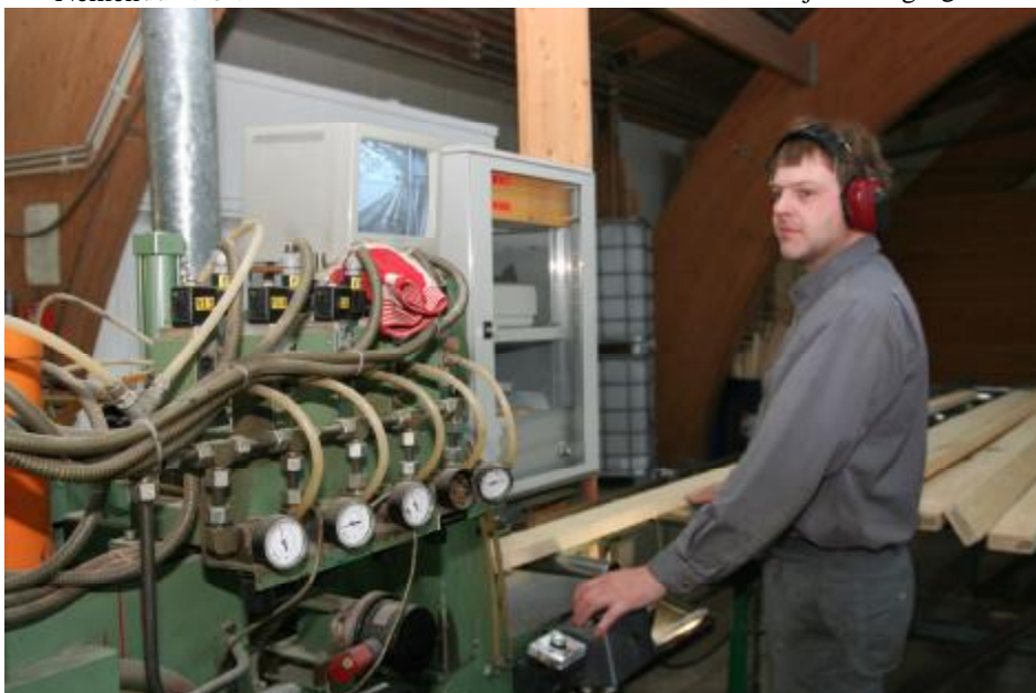
Úr Límtrésverksmiðjunni á Flúðum