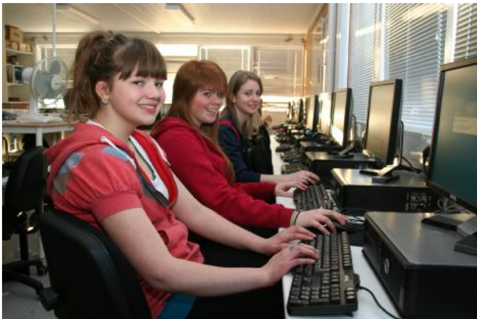
Nemendur við vinnu í tölvuveri Flúðaskóla