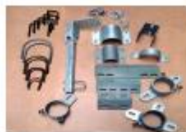
Fjölbreytt úrval festinga

Eigum ávallt á lager milligerðir, átgrindur, milligrindur, þriggjaröragrindur, steinbita, gúmmimottur og renninga ásamt fleiru í fjósið.