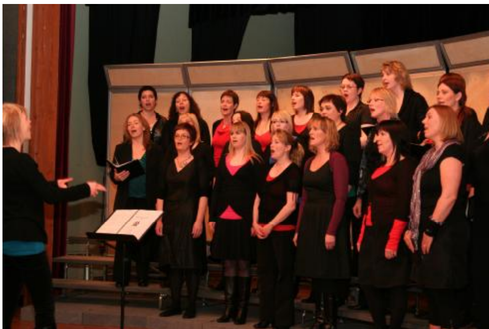
Uppsveitasystur á Vorkvennasöng í Félagsheimilinu á Flúðum þann 30 apríl sl, og Vörðukórinn á söngskemmtun í Félagsheimilinu á Flúðum þann 22. apríl sl.