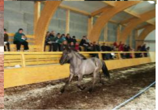
folaldasýningu 25 apríl og firmakeppni 1. maí