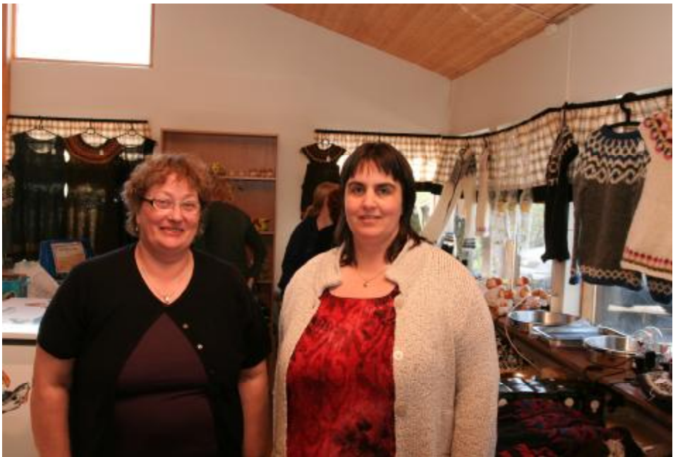
Um Hvítasunnuna var einnig opnaður Bændamarkaður í Ferðamiðstöðinni, en það