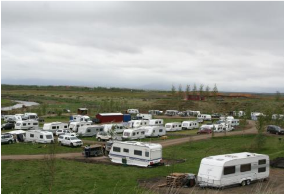
Nýja tjaldsvæðið á Flúðum var opnað um Hvítasunnuna.