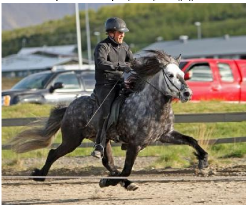
Heimsmethafinn Tenór frá Túnsbergi með 9,15 fyrir hæfileika.