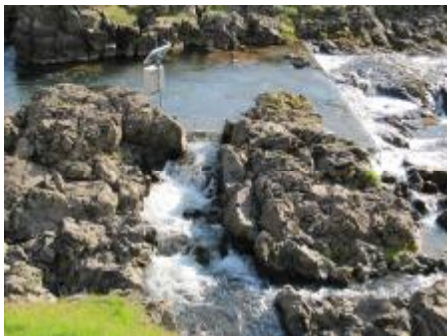
Laxateljari í Litlu Laxá við Berghyl Súluarit yfir laxgengd í Litlu-Laxá sumarið 2009 talið með sjálfvirkum laxateljara við Berghyl. Greint er milli lax og silungs.

Vonast er til að laxateljarinn verði áfram starfræktur við Berghyl og verður forvitnilegt að fylgjast með fiskgengd í Litlu-Laxá í framtíðinni og jafnframt að sjá hvernig til tekst með nýtingu árinna og hvort hún verði aðdráttarafl fyrir veiðimenn og skili veiðiréttarhöfum arði af veiðinni. Af þeim forsendum sem fyrir liggja ætti slíkt að geta orðið.