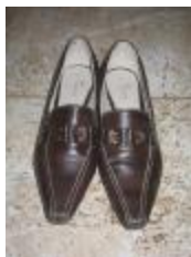
St . 39