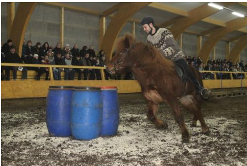
Guðmann á fullri ferð í “smalanum” í 1.umf Uppsveitadeildarinnar.