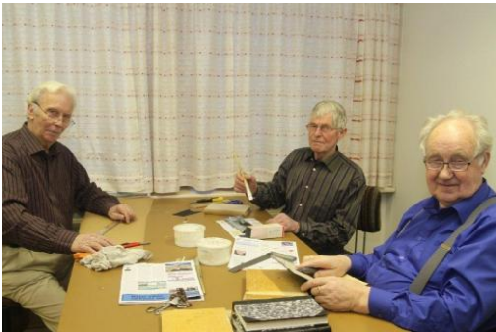
Unnið við bókband í Heimalandi.