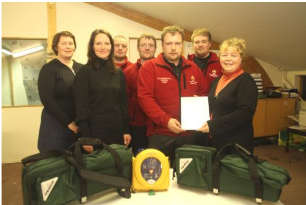
Á dögunum afhenti Kvenfélagið Björgunarfélaginu góðar gjafir .