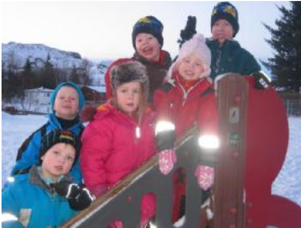
Hressir Skógarkotskrakkar í útiveru