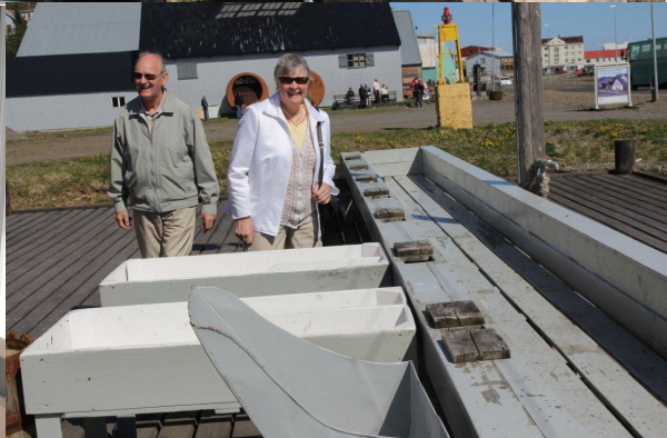
Eldri Hrunamenn fóru á dögnum í ferðalag norður í land og komu ma.við í Héðinsfirði og Siglufirði: Ljós:SigSigm