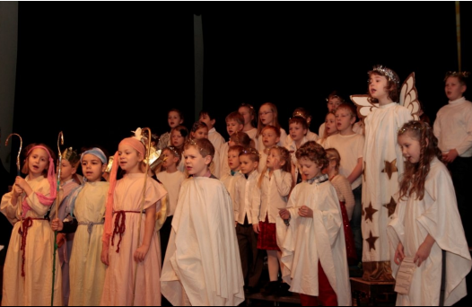
Nokkrar myndir frá Litlu jólunum í Flúðaskóla.