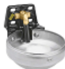
SU1001200 Vatnsd. stór Ryðfrír