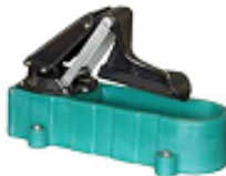
SU1000545 Vatnsd. m/dásu fyrir betlarhöf