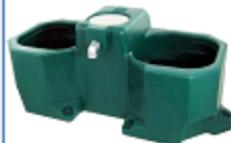
SU1600102 Drykkjarkar 80 L