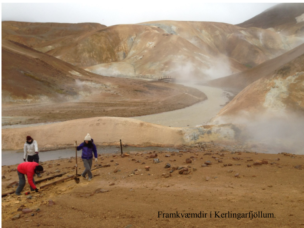
Framkvæmdir í Kerlingarfjöllum.