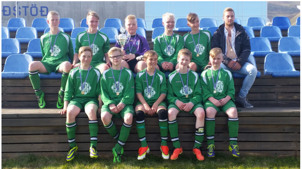
Íslandsmeistarar Hrunamanna í 7 manna fótbolta í 4. flokki karla.