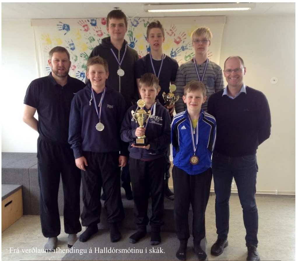
Frá verðlaunaafhendingu á Halldórmóttinu í skák.