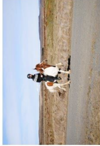
Taktgott, mikið framgrip, skrefmikið

bara@fludaskoli.is / ragnhildur.eythors@gmail.com