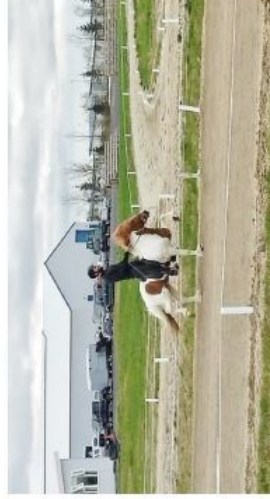
Skrefmikið, há fótlyfta

þar af 8,5 fyrir samræmi og fótagerð og 8,0 fyrir höfuð, háls og bak