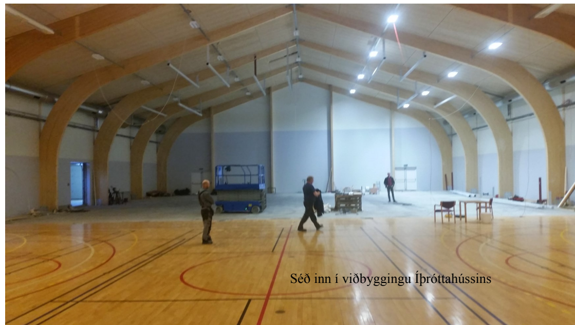
Séð inn í viðbyggingu Íþróttahússins