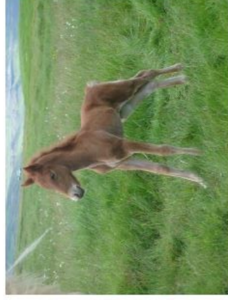
Glæsilegt folaid undan Amper