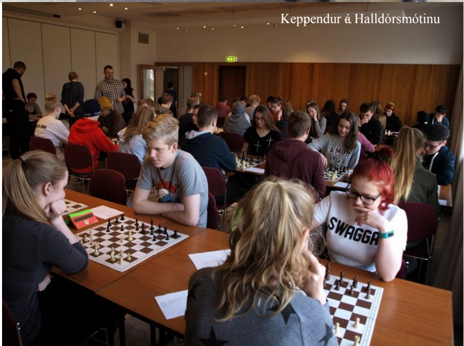
Keppendur á Halldórmóttinu