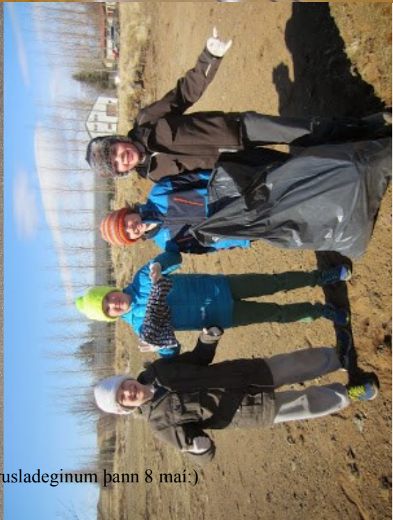
Frá rusladeginum þann 8 maí:)