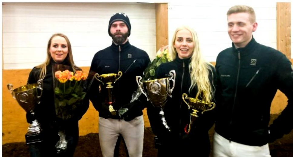
Hrosshagi / Sunnuhvoll Sigurvegarar Uppsveitadeildarinnar 2016.