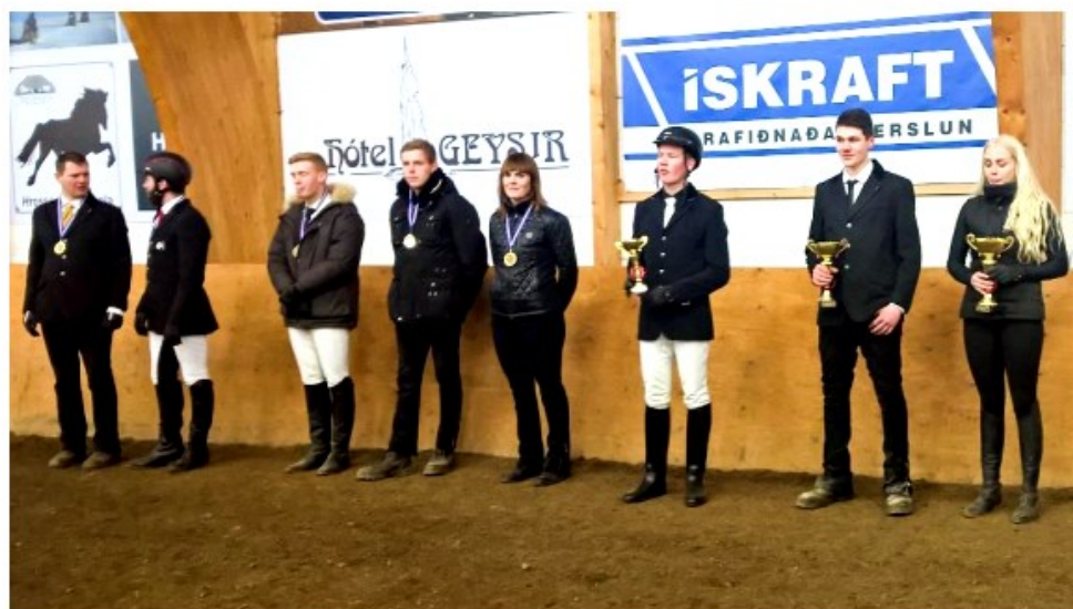
Sigurvegarar í fljúgjandi skeiði