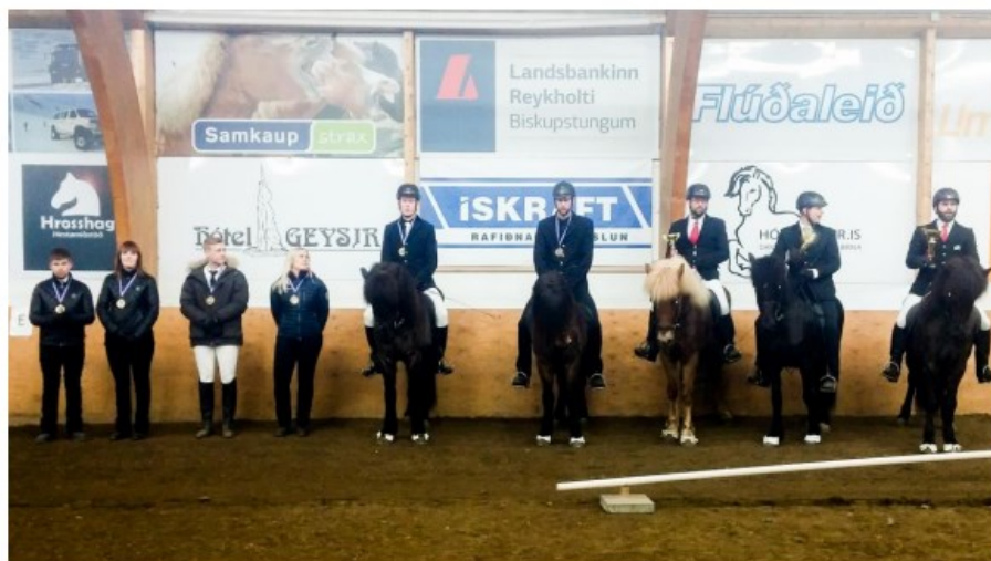
Sigurveggar í tölti