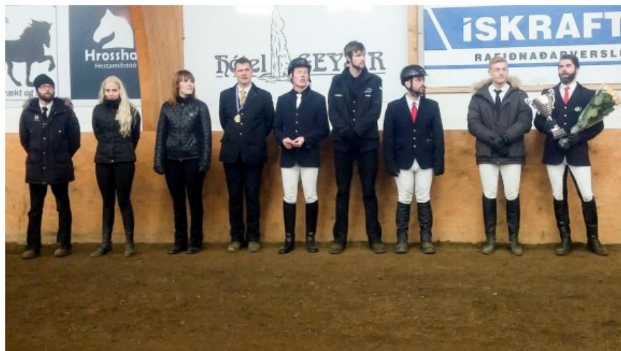
Efstu knapar í einstaklingskeppni Uppsveitadeildarinnar 2016