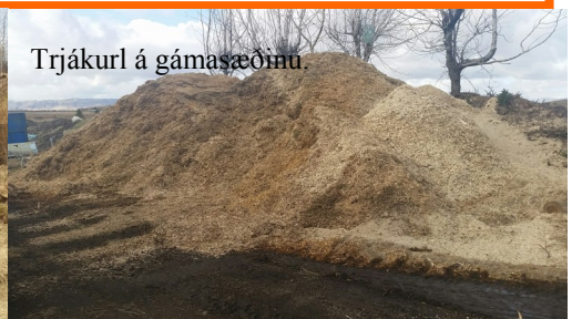
Trjákuril á gámasæðinu.