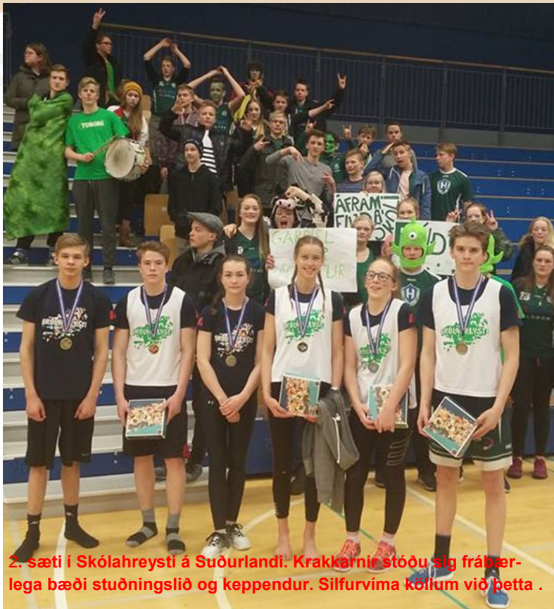
2. sæti í Skólahreysti á Suðurlandi. Krakkarnir stóðu sig frábærllega bæði stuðningslið og keppendur. Silfurvíma köllum við þetta .

Nánari upplýsingar koma fram á heimasíðu BÁ, www.babubabu.is eða í síma 4-800-900.