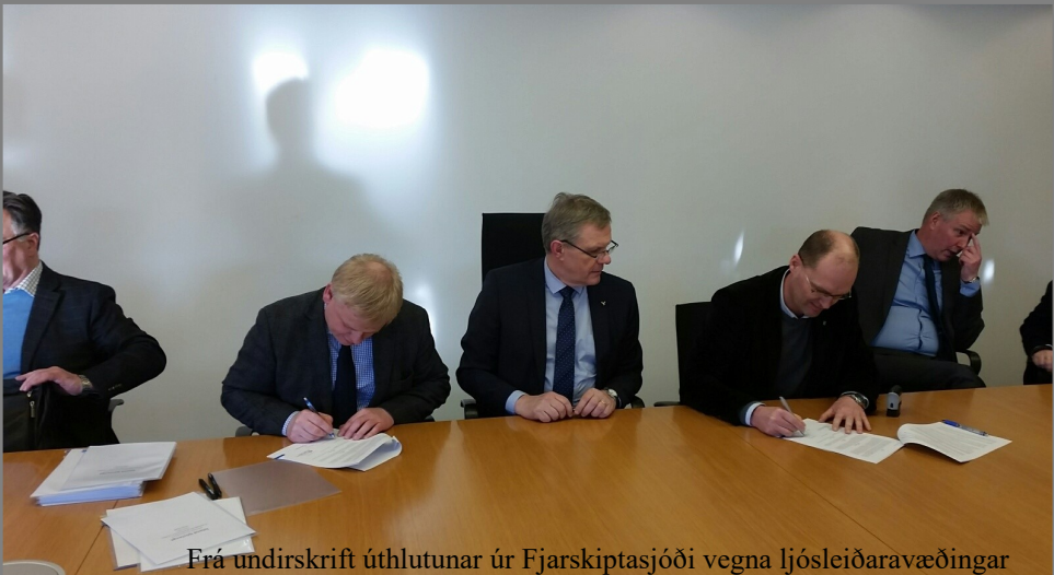
Frá undirskrift úthlutunar úr Fjarskiptasjóði vegna ljósleiðaravæðingar