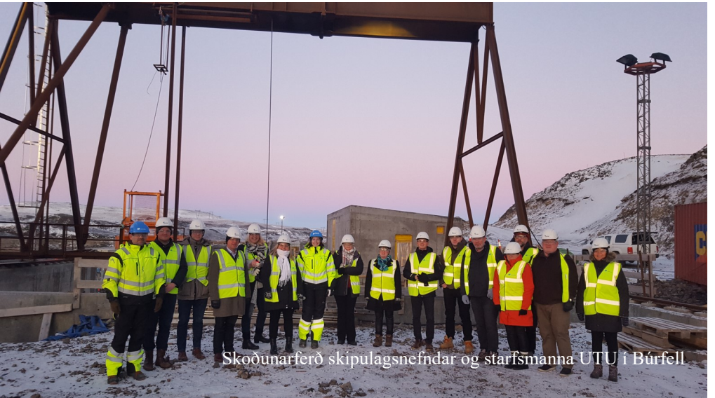
Skoðunarferð skipulagsnefndar og starfsmanna UTU í Búrfell