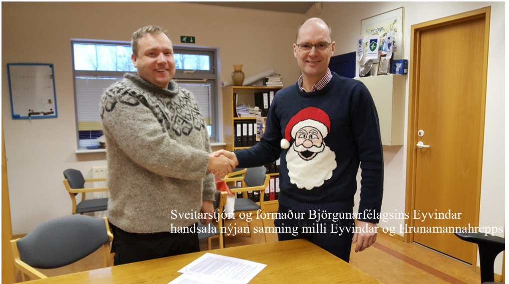
Sveitarstjóri og formaður Björgunarfélagsins Eyvindar handsala nýjan samning milli Eyvindar og Hrunamannahrepps