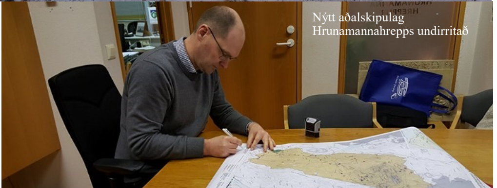
Nýtt aðalskipulag Hrunamannahrepps undirritað