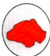
Nærfatnaður eða tuskur