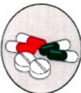
Lyf og vitamin