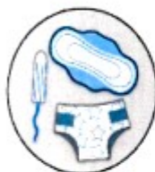
Dómubindi, bleyjur og tíðatappar

Allt sem við setjum í frárennslið hefur áhrif á nærumhverfi okkar. Eftirfarandi hlutir geta stíflað frárennslið, pípur og dælur eða mengað umhverfið og á ekki að sturta niður í klósettið.