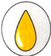
Olía eða önnur feiti