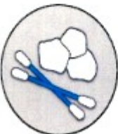
Eymapinnar og bómullarhnoðar