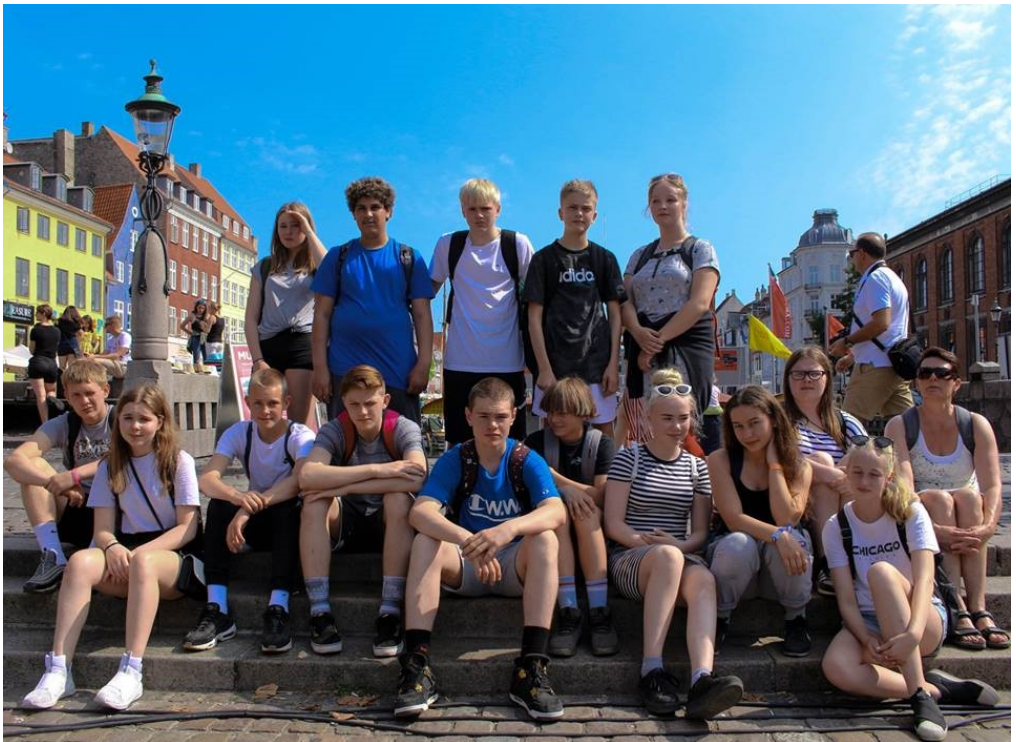
Stefán Þorleifsson tók myndina af hópnum í Kaupmannahöfn