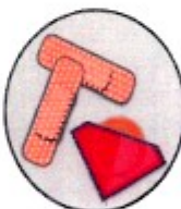
Smokkar, plástrar og sáraumbúðir