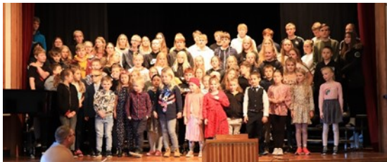
Nemendur og starfsfólk Flúðaskóla

Á þriðja hundrað gesta komu og áttu með okkur skemmtilega stund og viljum við þakka öllum innilega fyrir komuna.