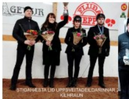
STIGAHESTA LIÐ UPPSVEITAEILDARINNAR 2 KILHRALIN