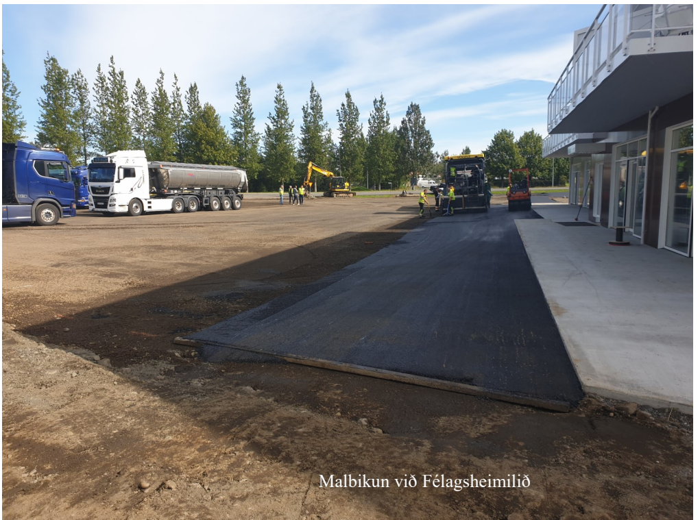
Malbikun við Félagsheimilið